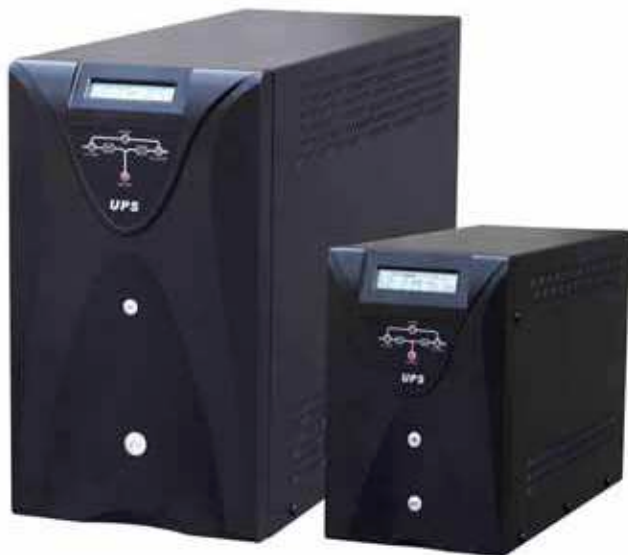
EA SIN 3000