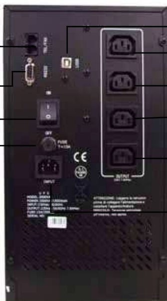
Vista posteriore EA SIN 2000