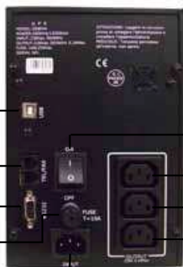
EA SIN 2000